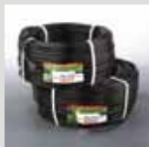
Rollos de 100 metros