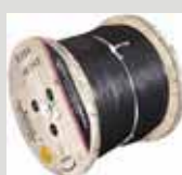
Bobinas de madera